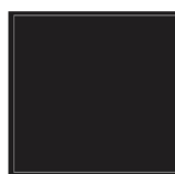
Interior da tampa